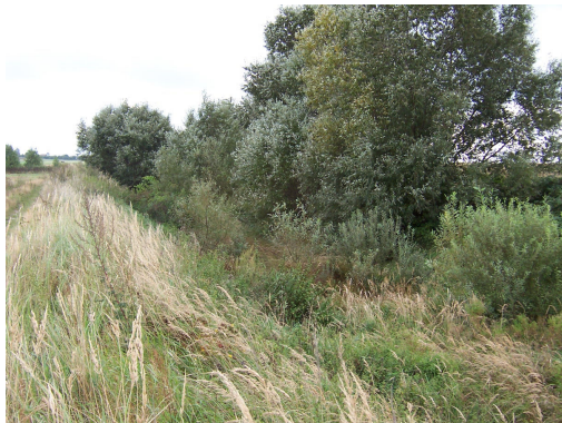
1. Krajobraz śródpolny przy trasie byłej kolejki wąskotorowej

Geograficznie Mokrsko przynależy do mezoregionu Wysoczyzny Wieruszowskiej zaliczanej do podprowincji nizin środkowopolskich i makroregionu Niziny Południowowielkopolskiej. W Mokrsku znajduje się Park Wiejski wraz z dworem szlacheckim z XIX wieku i 3 stawami rybnymi. Eksploatowane są pokłady surowców krzemionkowo-okruchowych (piasek, żwir) oraz ilów, służących do wyrobu wysokogatunkowej cegły. W obrębie miejscowości działa cegielnia. Największy we wsi Zakład Produkcyjny „Euromeat”, zajmujący się ubojem trzody chlewnej oraz rozbiorem mięsa wołowego i wieprzowego posiada własną oczyszczalnię ścieków. Znajduje się tutaj również największe gospodarstwo rolne w gminie prowadzące tucz trzody chlewnej. Tereny sołectw są zmeliorowane - występuje system rowów melioracyjnych. Istnieje również kilka stawów i oczek wodnych. Występują zadrzewienia śródpolne, a także zagajniki drzew i krzewów.