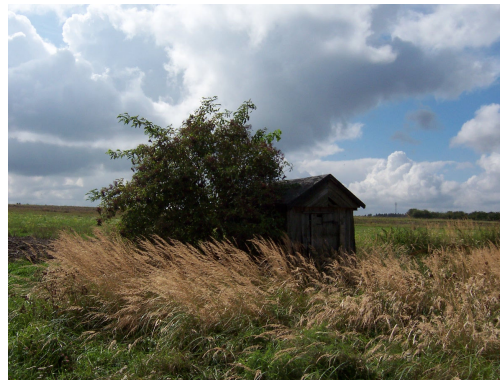
2. Punkt poboru wody przy trasie byłej kolejki wąskotorowej